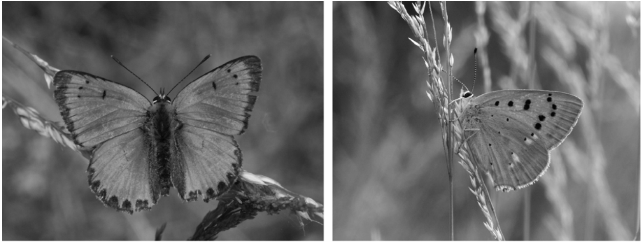
Fig. 2. A Lycaena virgaureae (Linnaeus, 1758) é uma espécie característica do planalto de Montesinho, onde é possível encontrá-la a partir dos 1.000m, de fins de Junho a princípios de Agosto.